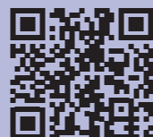
Text und Layout: Thomas Steinecke